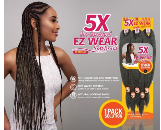
5X EZ WEAR BRAID 48" (PERM YAKY) AVAILABLE COLORS: 1, 1B, 2, 4, T1B/27, T1B/30, T1B/6G, T1B/350, T1B/613