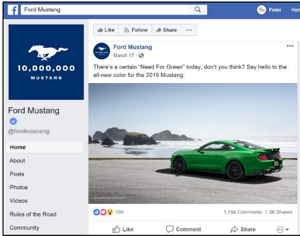
[FORD MUSTANG 브랜드 홍보 페이지]